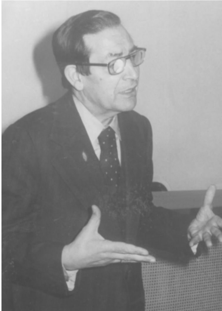
Ramón Piñeiro López (1915 - 1990)