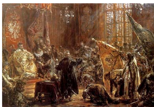
Imagen 4: Basilio IV a los pies de Segismundo III en Varsovia (Jan Matejko, 1892).

Estas imágenes recrean un suceso de la guerra polaco-rusa donde un rey llamado Basilio se pone a los pies de Segismundo de Polonia, situación que se repetirá tal cual en La vida es sueño (vv. 3147 y ss.). ¿Casualidad? Quizás no tanto, aunque las coincidencias no pasan de aquí, pues los hechos posteriores que acontecen en la historia de Polonia y en la comedia siguen líneas divergentes.