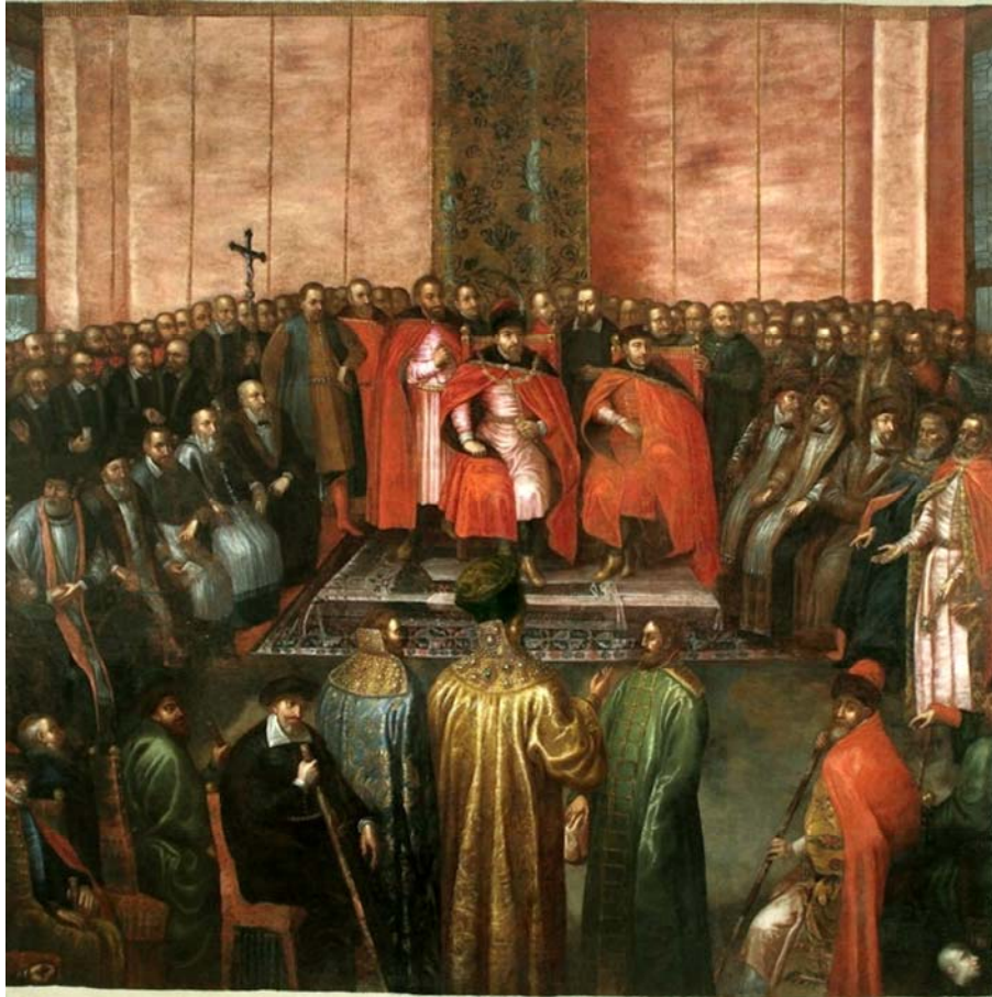
Imagen 1: El depuesto zar Basilio IV y sus hermanos (de pie) en el Parlamento de Varsovia, ante el rey Segismundo III y el príncipe Ladislao Segismundo (sentados). Escuela de Tommaso Dolabella (h. 1620). Lviv Historical Museum (Leópolis, Ucrania).