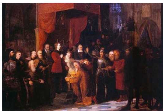
Imagen 3: Basilio IV ante Segismundo III en Varsovia (Jan Matejko, 1853). Museo Nacional de Wroclaw.