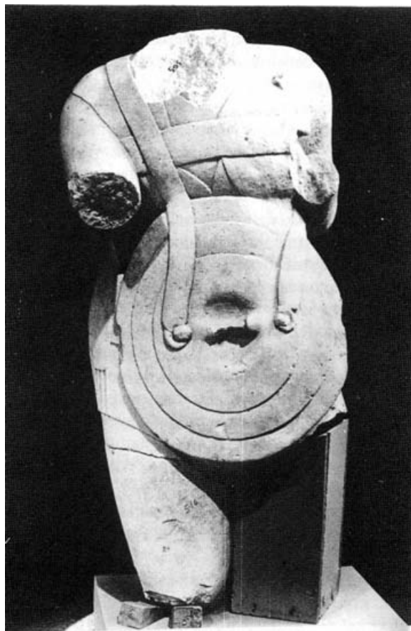
Figura 2. Torso de Guerrero. Obulco. Museo Provincial Jaén.

de compacto, de bloque uniforme, que sólo parece ser roto por la acción de avance del hombro y brazo derechos, que nos aporta sugerencias de dinámica con la figura en acción. Y es el escudo el que cubre un importante espacio en el conjunto de la figura, uniéndola a su juego superpuesto de planos circulares, lo que le convierte en el foco principal de atención.