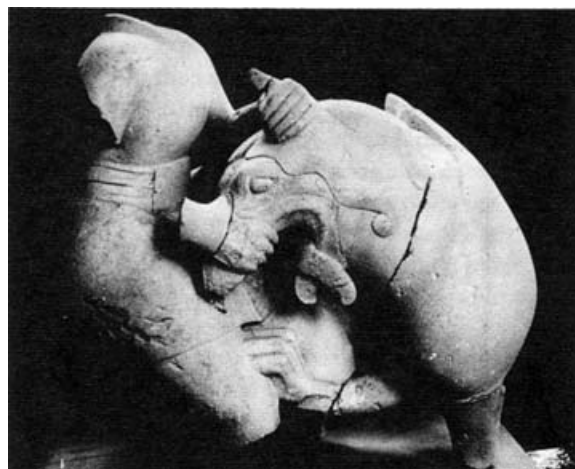
Figura 2. Gripomaquia. Obulco. Museo Provincial. Jaén.

La escultura griega, en cambio nunca trató la gripomaquia, mas sí la ibérica. En la misma más que como la plasmación de ciertos mitos, quizá debió ser utilizada sencillamente como un tema decorativo.