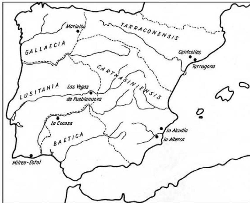
Abb. 2. Orte mit christlichen Bauten des 4. und 5. Jh. Nach Schlunk-Hauschild, Hispania Antiqua.

errichteten von Son Bou, Es Fornás de Torelló, Es Cap des Fort Fornells, Isla del Rey und Ciudadela auf Menorca — sie alle zeigen afrikanischen Einfluß. Die Mosaiken in