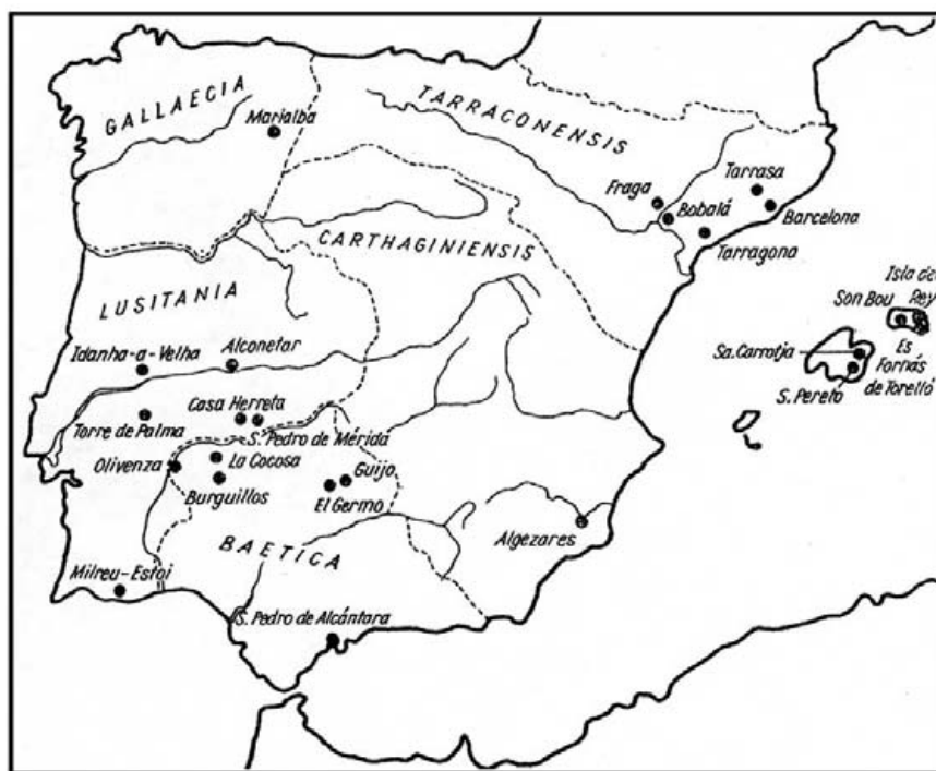
Abb. 3. Orte mit Taufpiscinen. Nach Schlunk-Hauschild, Hispania Antiqua.

Die Predigt des Evangeliums 28 in ländlichen und wenig romanisierten Zonen des [-657→658-] hispanischen Nordostens brachte die Romanisierung dieses Gebietes mit sich, 29 die im 4. Jh. voranschritt und nach der Ankunft der Sueben, Wandalen, Alanen und Westgoten 30 durch die Werke der Kirche fortgeführt wurde.