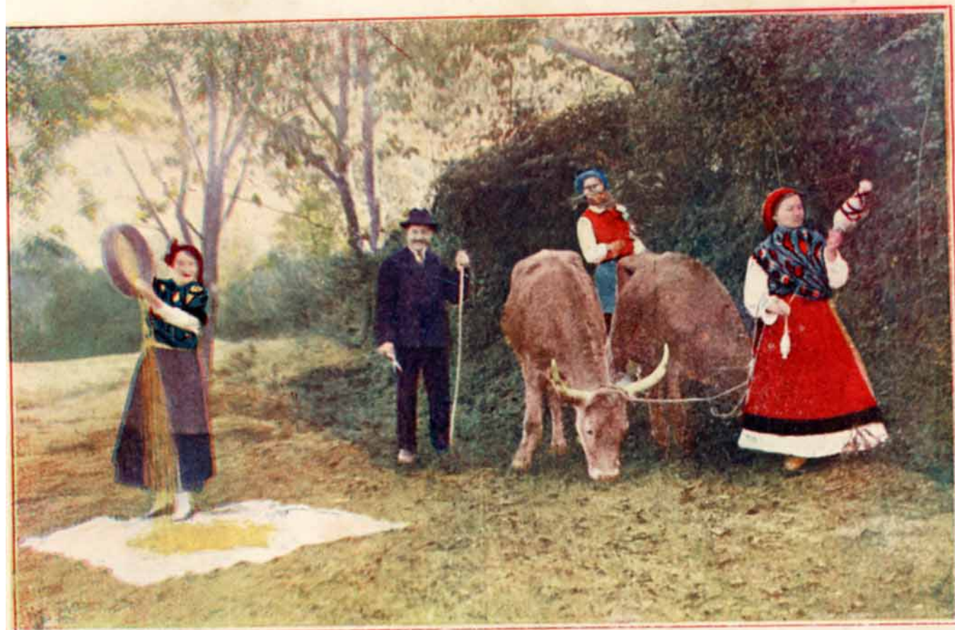
FAENAS DEL CAMPO