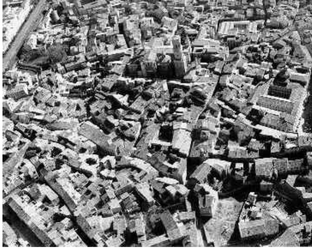
Ilustración 2 Vista panorámica de Tudela. AYUNTAMIENTO DE TUDELA.1996