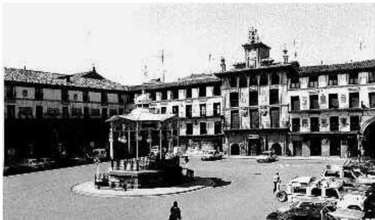
Ilustración 3. Casa del Reloj en la Plaza de los Fueros. Centro Histórico de Tudela. Departamento de Urbanismo. Ayuntamiento de Tudela. (1994) Puente al Futuro. Navarra.