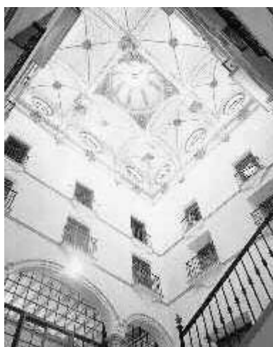
Ilustración 5. Interior del Palacio del Marqués de Huarte. Rehabilitación y puesta en valor como Biblioteca Municipal y Archivo civil.