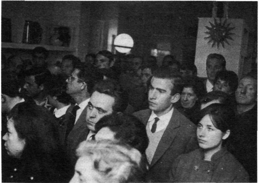
10 de març de 1969: Acte d'inauguració de la Llibreria Tres i Quatre (València), una important fita en la recuperació cultural del País Valencià.