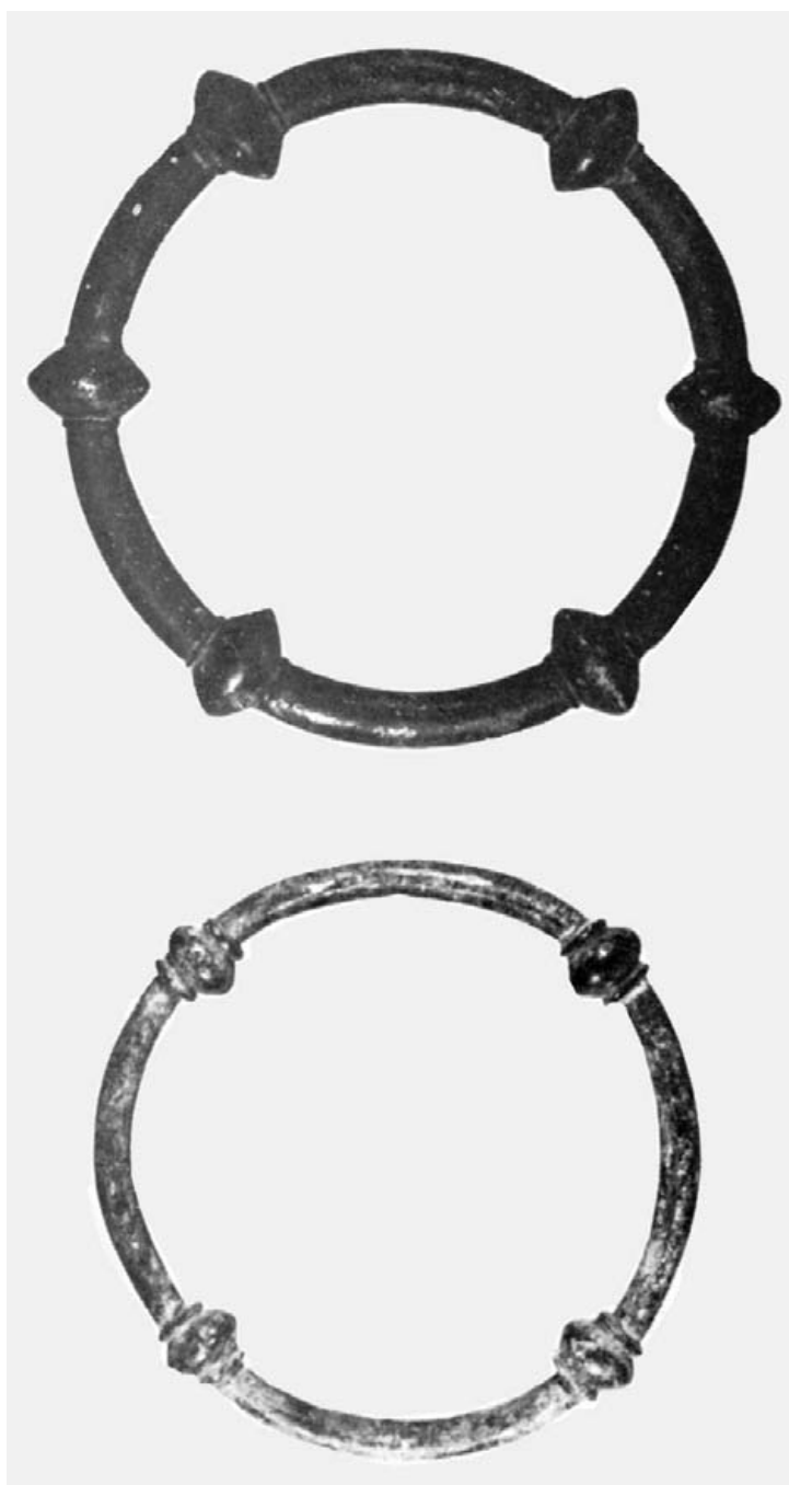
Anillos del Museo Arqueológico Nacional de Madrid