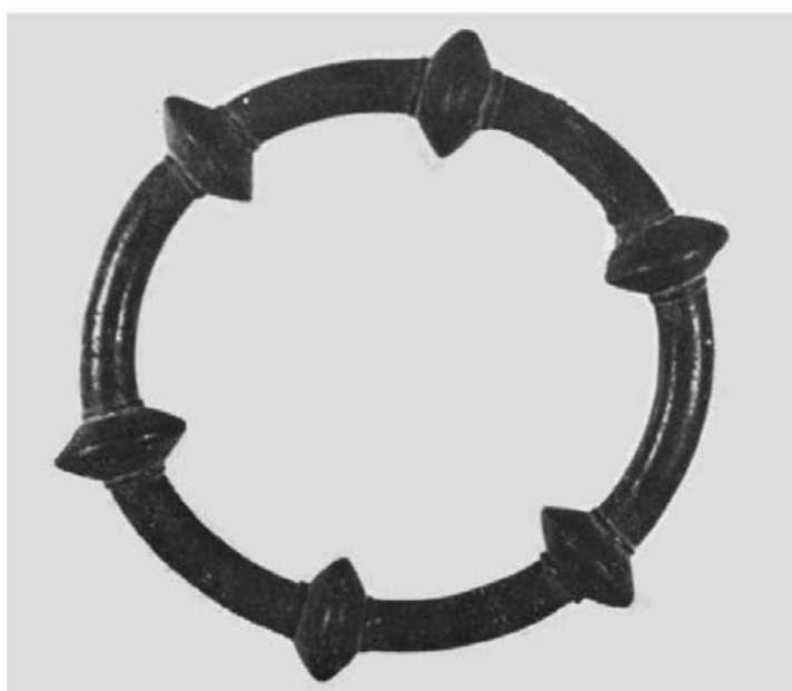
Anillos del Museo Arqueológico Nacional de Madrid