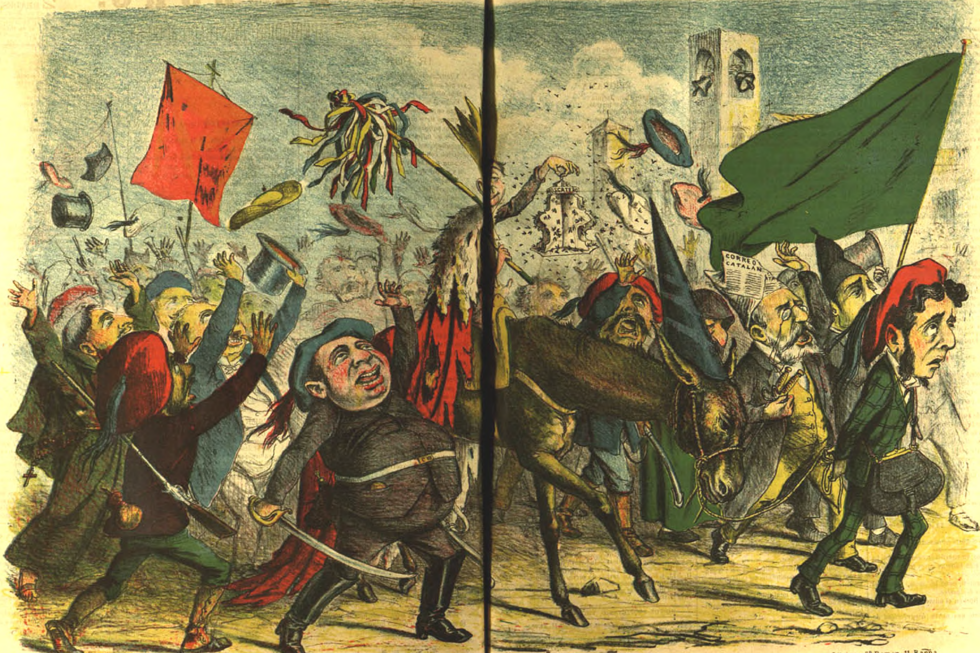
Consecuencias de la catstrofe del as de oros .