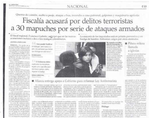
Texto 7 El Mercurio (08/09/2010)