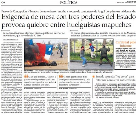
Texto 9 El Mercurio (30/09/2010)