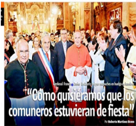
Texto 8 La Cuarta (19/09/2010)