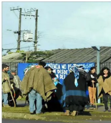
APOYO.— Centenar de personas se congregaron afuera del Hospital de Nueva Imperial donde está el machi.