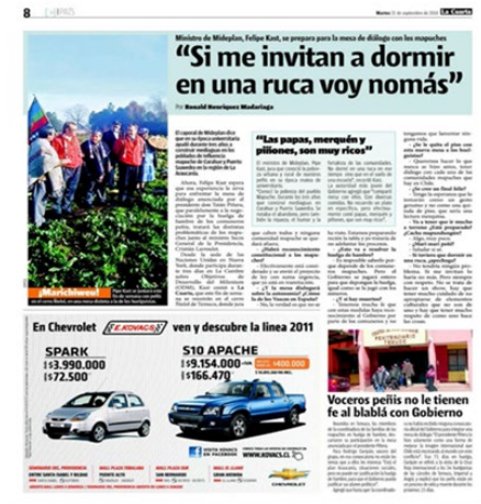
Texto 1 Diario La Cuarta (19/09/2010)