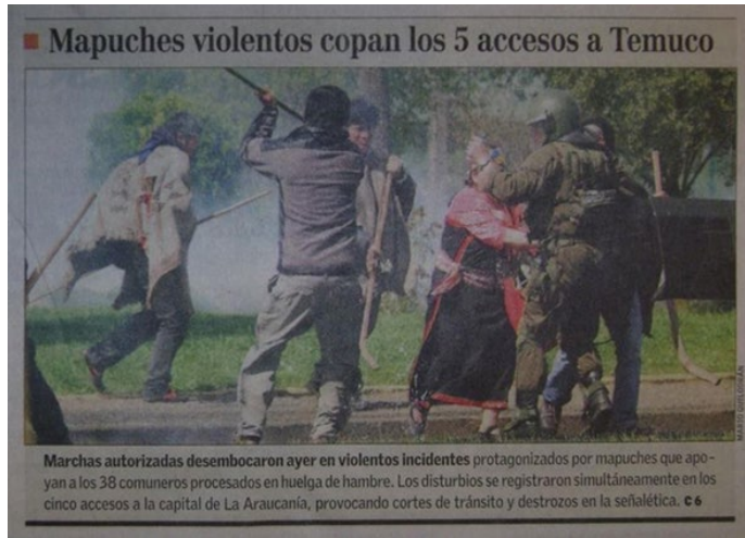
Texto 5 El Mercurio (30/09/2010)