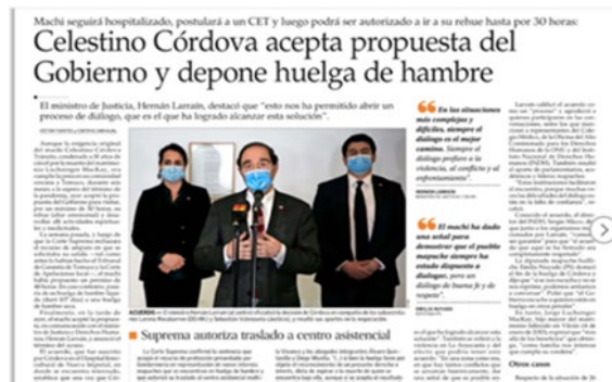
Texto 4 Diario El Mercurio (19/08/2020)

En efecto, se produce una lucha simbólica en la que dos mundos —el del Nosotros, los blancos y el de los Otros, los mapuches— han sido semiotizados por la prensa estudiada como superior e inferior, respectivamente. Consecuentemente, se produce una invisibilización de la etnia mapuche y sus demandas sociales, culturales y políticas.