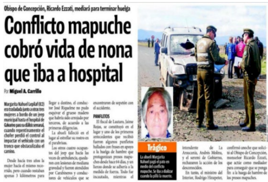
Texto 6 La Cuarta (14/09/2010)