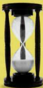
Fondos Monetarios y de Renta Fija