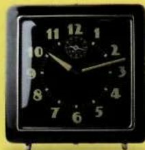
Fondos de Fondos