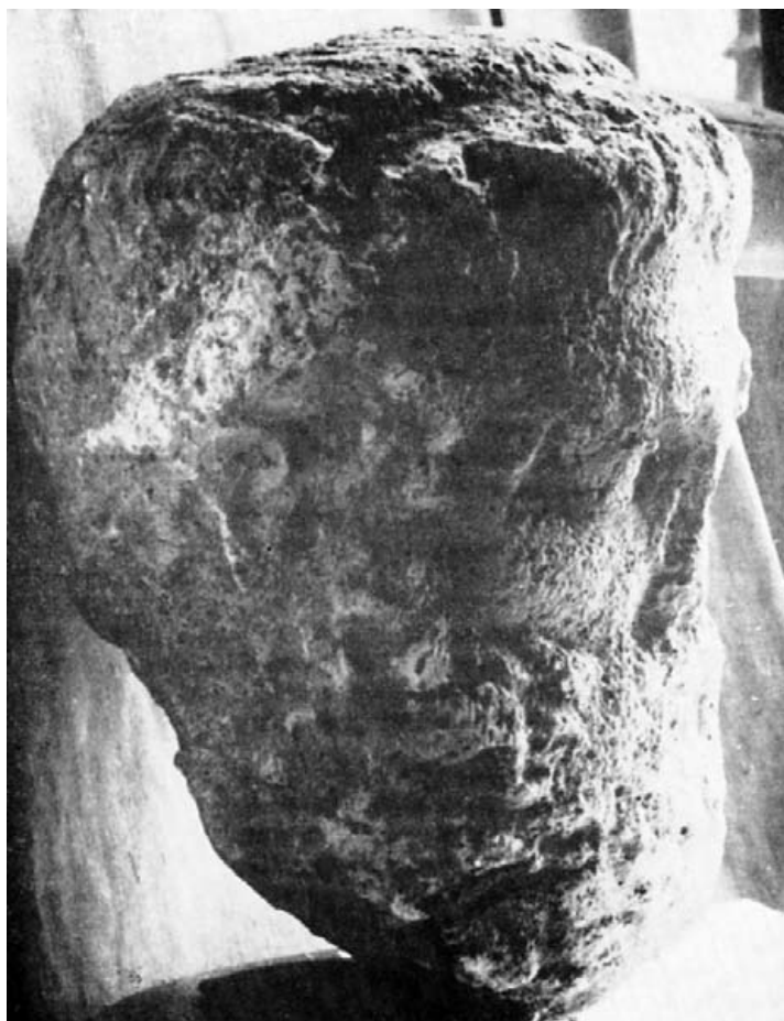
Fig. 2.– Perfil do la figura anterior.

Cabeza, varonil (fig. 3).– Representa a un hombre de mediana edad. La cabeza lleva el [-220→221-] pelo corto y rizado, al igual que la barba. Los pómulos son salientes, los ojos están dirigidos un poco a lo alto, la nariz es estrecha y la boca es pequeña y está cerrada. El mármol se ha convertido en caliza. Mide 32 cm, de longitud. Falta la nariz y hay desperfectos en el pómulo derecho y en las cejas. Las características estilísticas del retrato permiten datarlo a finales del siglo II o primeros años del siguiente. Reaparecen ellas en un busto de oficial africano del Museo Nazionale Romano 13 . Paralelos muy próximos a la cabeza de Toledo son igualmente la cabeza de griego, datada hacia el año 200, del Museo Vaticano 14 ; varias cabezas del arco triunfal de Septimio Severo en Leptis Magna, levantado en el año 203 15 , y en fecha anterior el busto hallado en Lullinstone, Kent, Inglaterra 16 , que ofrece todas las características del arte de la época de Adriano o de los primeros años de los Antoninos, y la cabeza, de final del período de los Antoninos, de Cirene 17 .