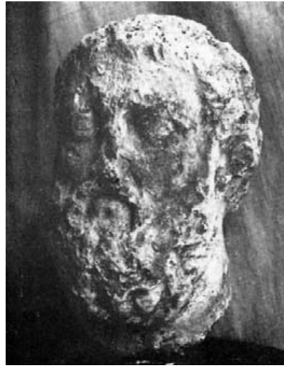
Fig. 3.– Cabeza varonil. Colección particular. Toledo.

Hispania ha dado pocos retratos pertenecientes a la corriente artística representada en estas cabezas de la provincia de Toledo; se asemeja a la primera, con diferencias grandes, la cabeza de Serapis, hallada en Emérita, datada en la segunda mitad del siglo II 18 también. El hallado en las murallas de Barcelona es aún más distante 19 .