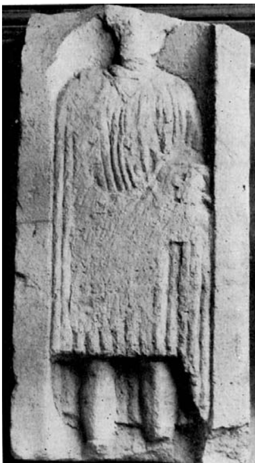
Fig. 5.- Peal de Becerro. Museo Arqueológico de Jaén