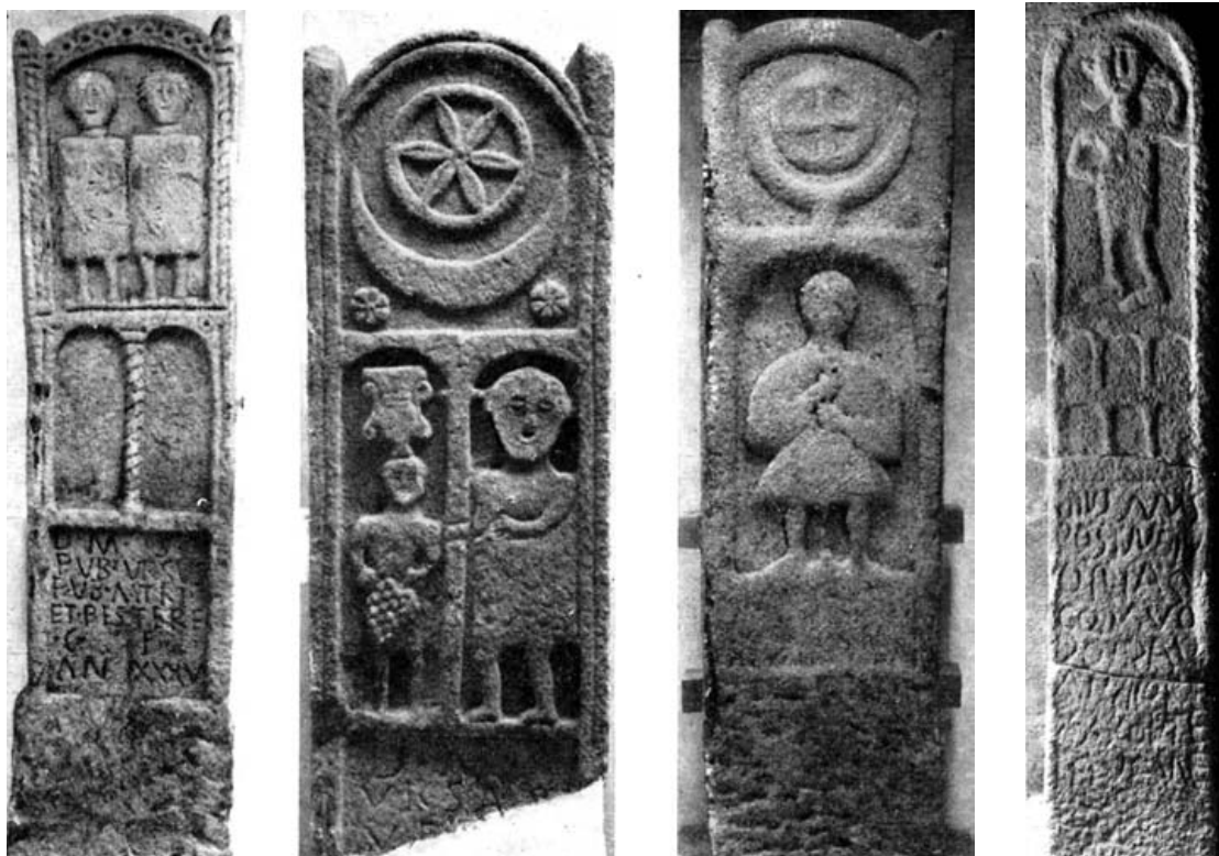
Fig. 14.- Tres de las estelas de Vigo. Museo Municipal de Castrelos.