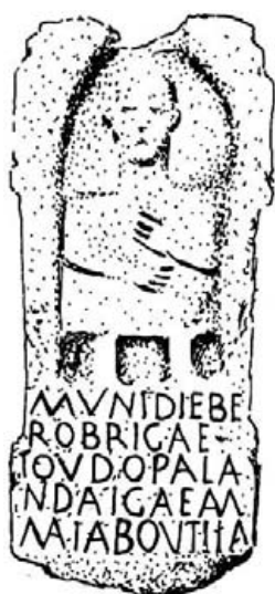
Fig. 8.- Talaván .

En la gran hornacina de sesgo, ligeramente apuntado, se figura un personaje en pie y de frente de muy ruda labra. Su cuerpo es cuadrado. La mano izquierda sobre el pecho, la derecha sobre el vientre. Cabeza grande y facciones muy toscas y deformes.