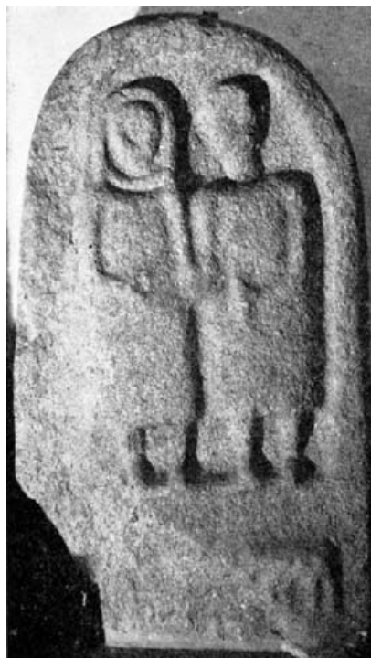
Fig. 13.- Bilhares. Museo de Soares dos Reis, Oporto.

abajo a las rodillas. Se lleva la mano derecha al pecho. En la izquierda, baja, tiene un objeto irreconocible. El plegado, en estrías anchas y paralelas. La cabeza, muy informe, deja reconocer no obstante un peinado que enmarca la cara. En la otra lestra relivaria se ve otro personaje similar con el brazo derecho por delante del cuerpo, mientras con la mano izquierda parece sujetar el asta de un bóvido, del que se ve la cabeza y se adivinan las patas delanteras. Todo sumamente rudo y sin propósitos descriptivos.