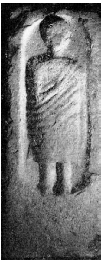
Fig. 1.- Cartagená. Museo de la localidad.

Hallada en 1925 a tres metros de profundidad al excavar los cimientos de la casa