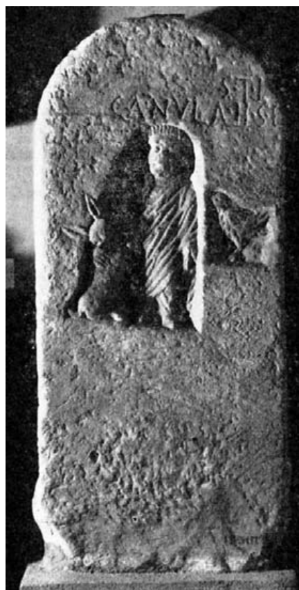
Fig. 2.- Castulo (Linares). Mus. Arq. de Madrid