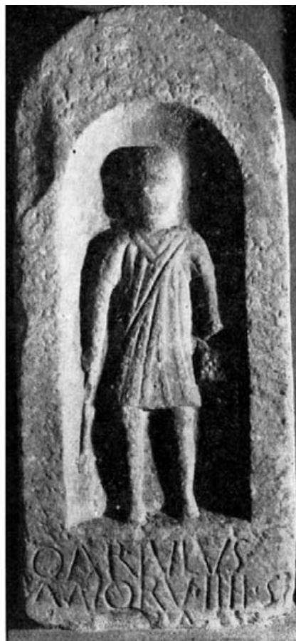
Fig. 6.- Baños. Museo Arqueológico Nacional.