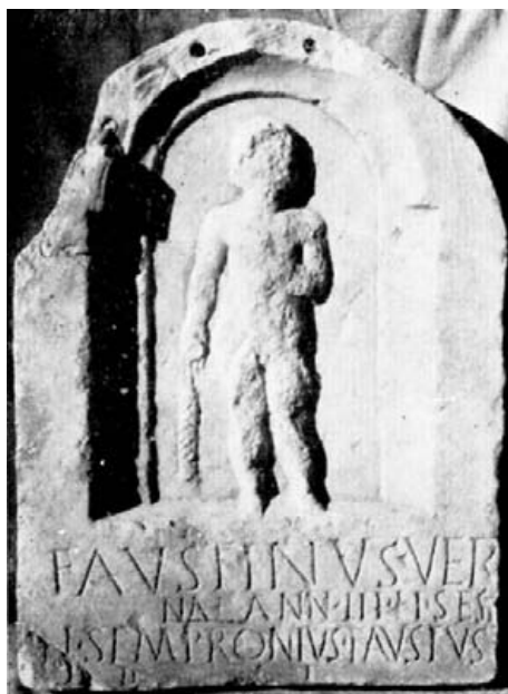
Fig. 7.- Estela emeritense. Museo Arqueológico de Sevilla.

En la gran hornacina de sesgo, ligeramente apuntado, se figura un personaje en pie y de frente de muy ruda labra. Su cuerpo es cuadrado. La mano izquierda sobre el pecho, la derecha sobre el vientre. Cabeza grande y facciones muy toscas y deformes.