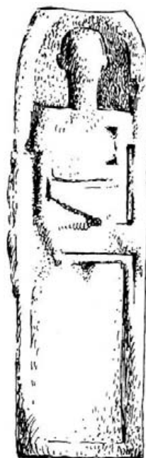
Fig. 9.- Valdunciel (Salamanca).