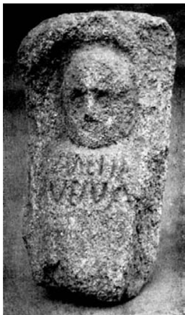
Fig. 10.- Castro de San Facundo. Museo de Orense.