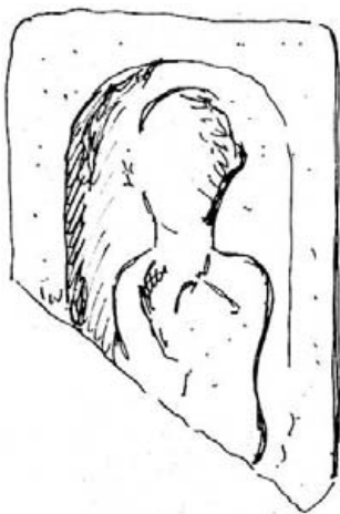
Fig. 12.- Santa Tecla. Museo local.

En las dos se ve una hornacina y dentro de ella sendas figuras. En una, un personaje vestido con una especie de toga corta bajo la cual aparecen las piernas desde más