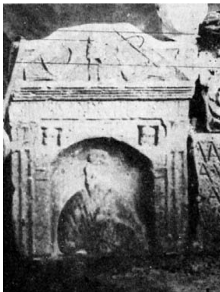
Fig. 4 B.- La estela de la figura anterior tal como la conoció Góngora.

Falta la parte superior, que cerraba en medio círculo, como las dos primeras y acaso también la tercera. De él queda claro el arranque en el lado izquierdo. El nicho, en cuarto de esfera, se ha conservado casi íntegro. Dentro de él se figura un personaje en pie, de frente, vestido con túnica corta y escotada en ángulo, muy similar en ello a la que