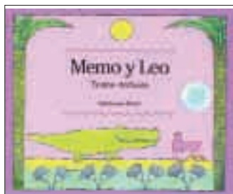
Memo y Leo Bill and Pete Tomie dePaola 23 x 18,5 cm 32 páginas Rústica, engrapado ISBN 980-257-223-3

Ha llegado el momento en que Memo debe buscar un cepillo para sus hermosos dientes de cocodrilo. En la tienda del Sr. Hipopótamo, entre los pajaritos que sirven de cepillos de dientes a los cocodrilos, Memo escoge uno muy simpático llamado Leo, que se convierte en su mejor amigo. Esta singular amistad que se desarrolla a orillas del Nilo, está inspirada en la simbiosis que existe entre el chorlito africano y los cocodrilos egipcios.